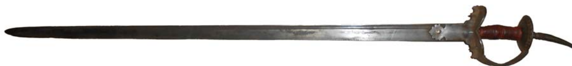
Рис. 1. Меч. МАЭ № 6654-9/1