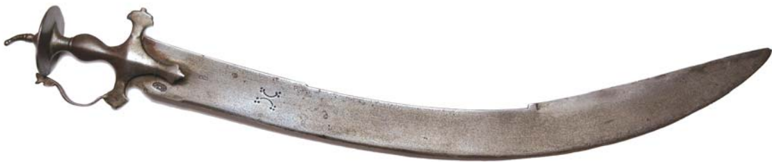
Рис. 6. Тегха. Частная коллекция. Фотография автора