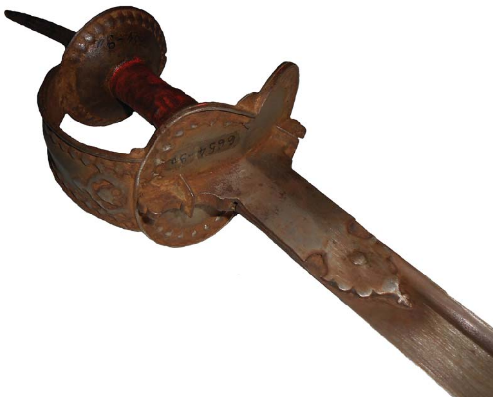
Рис. 3. Меч. МАЭ № 6654-9/1. Рукоять. Деталь