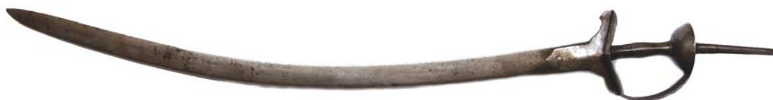
Рис. 4. Сабля. Частная коллекция.