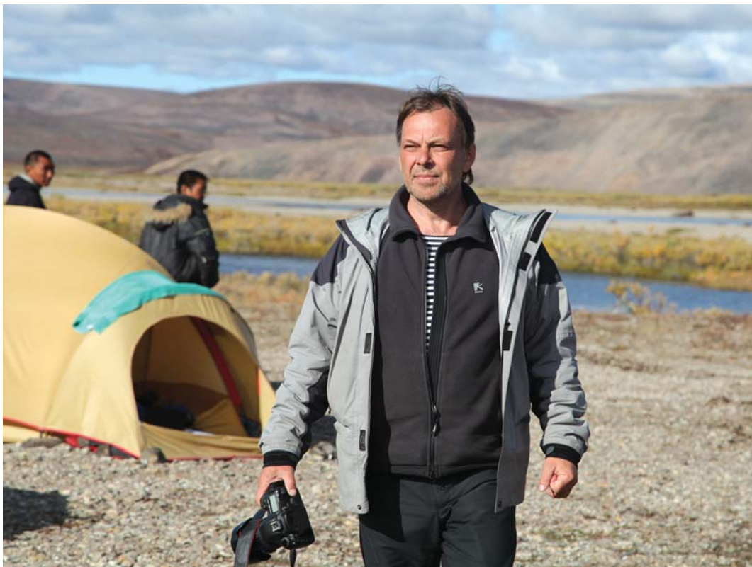
Рис. 4. Экспедиция в Чаунской тундре, Чукотка, 2014 г.