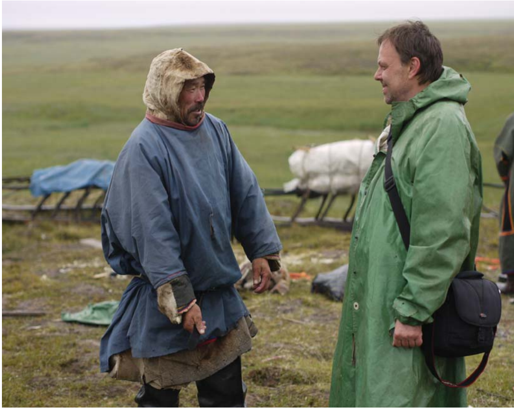
Рис. 3. Экспедиция в Харасавэйской тундре. Ямал, 2013 г.