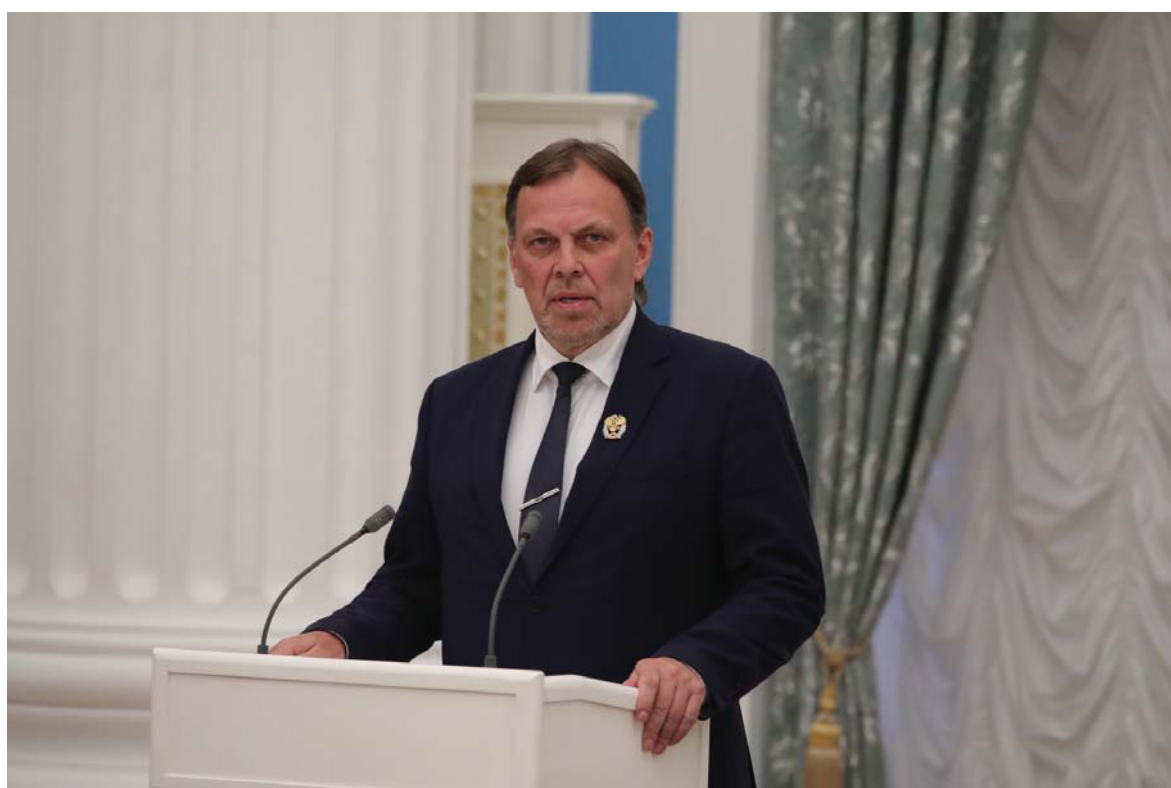
Рис. 5–6. Церемония вручения Государственной премии РФ. Москва, Кремль, 24 июня 2020 г.