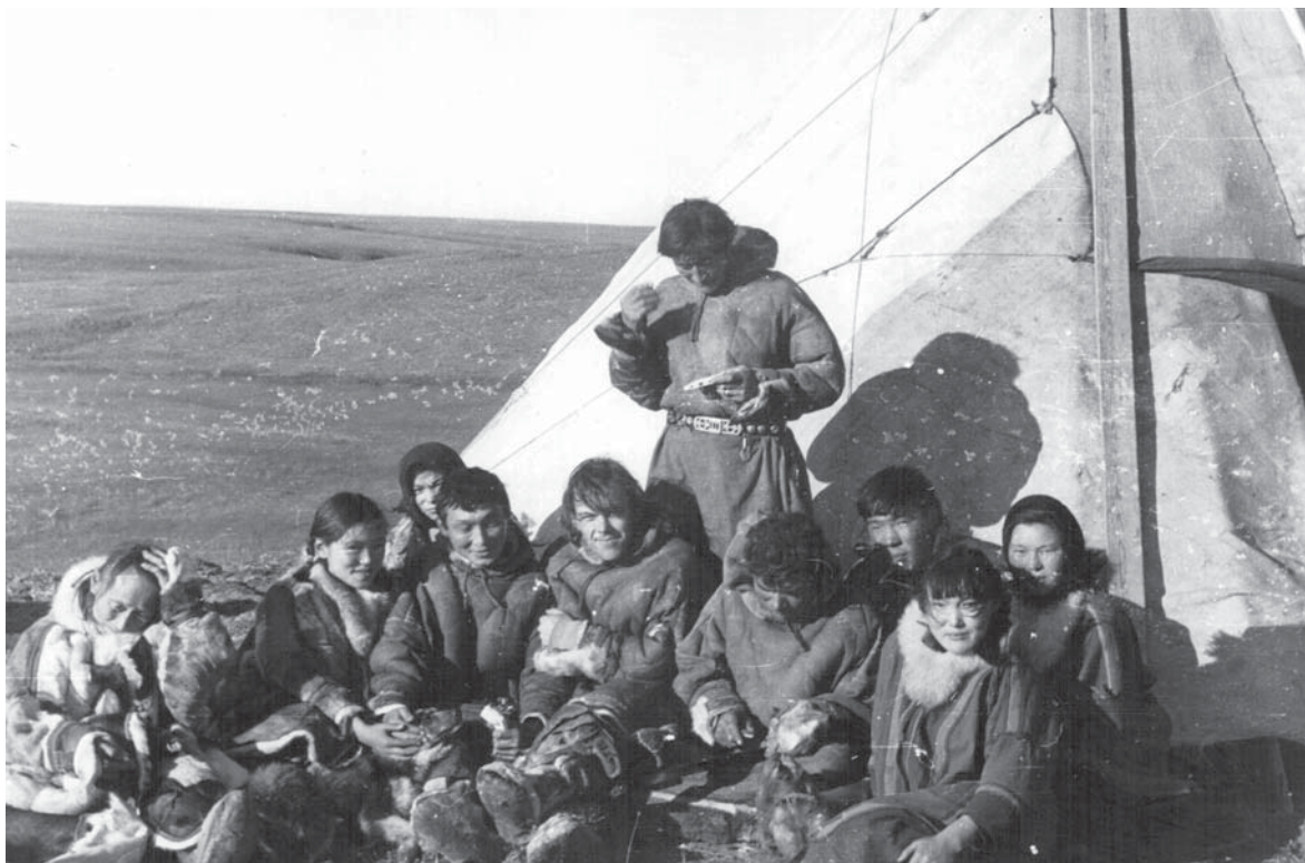
Рис. 2. Экспедиция к ненцам. Полуостров Гыдан, 1979 г.