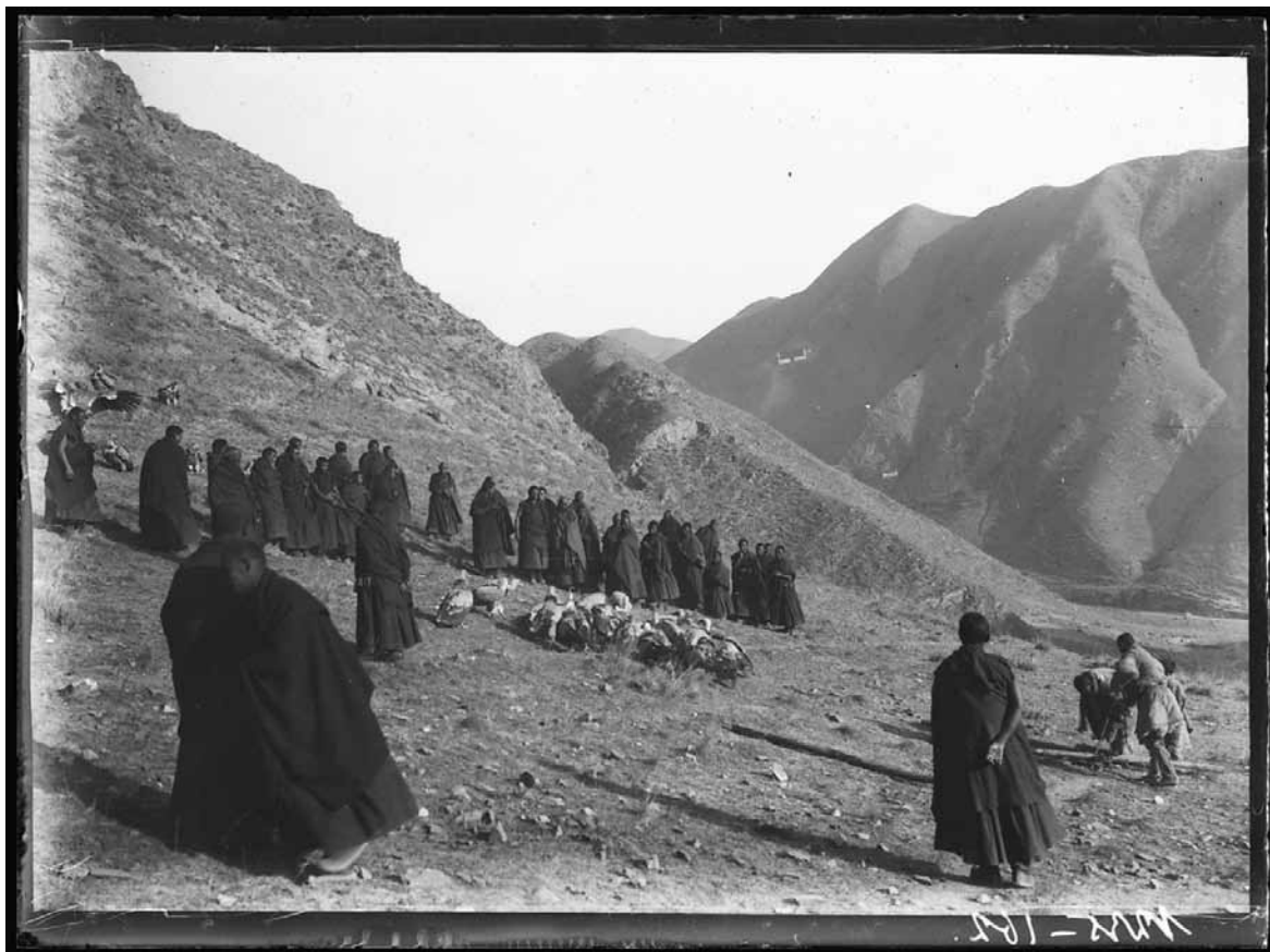
Рис. 3. Монахи наблюдают за грифами, поедающими тело покойного ламы. 1906. Б. Б. Барадийн. МАЭ № 1235-162

раскладывания тела на земле и привязывания к нему веревки, ламы отходили в сторону и птицы набрасывались на свою добычу (МАЭ № 1235-162, 271, 272) (рис. 3). С помощью ножа, спустя время, монахи дополнительно разделявали на части труп (МАЭ № 1235-165). Птицы расходились только когда от него оставались лишь «самые трудные, недоступные им крупные куски костей» (Барадин 2002: 222). В описи музейной коллекции МАЭ № 1235 негативы, которые иллюстрируют похороны ламы, имеют следующие названия: «Монахи», «Монахи в пути», «В горах в дороге», «Кормление священных птиц» (МАЭ РАН. Опись коллекции МАЭ 1235. Л. 6, 10). Благодаря дневниковым записям Барадийна объем информации о сюжетах, изображенных на этих материалах, значительно расширился.