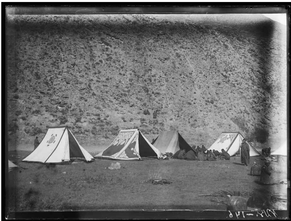
Рис. 4. Летние палатки монахов у подножья горы. 1906. Б. Б. Барадийн. МАЭ № 1235-146

О. Норзунов 16 (Андреев 2008: 193–195). Фотографические негативы иллюстрируют текст дневника Барадийна, создавая репрезентацию культурного и духовного наследия монастыря Лавран. Сравнение дневниковых записей с изображениями на негативах позволяет ответить на вопросы, связанные с атрибуцией этих фотографических материалов, восстановить историю их создания и поступления в фонды МАЭ РАН. Публикация экспедиционных материалов с использованием современных возможностей сканирования и цифровой ретуши изображений ввиду ограниченных возможностей по реставрации негативов на стекле на территории РФ представляется наиболее перспективным направлением в дальнейшей работе с материалами экспедиции Барадийна.