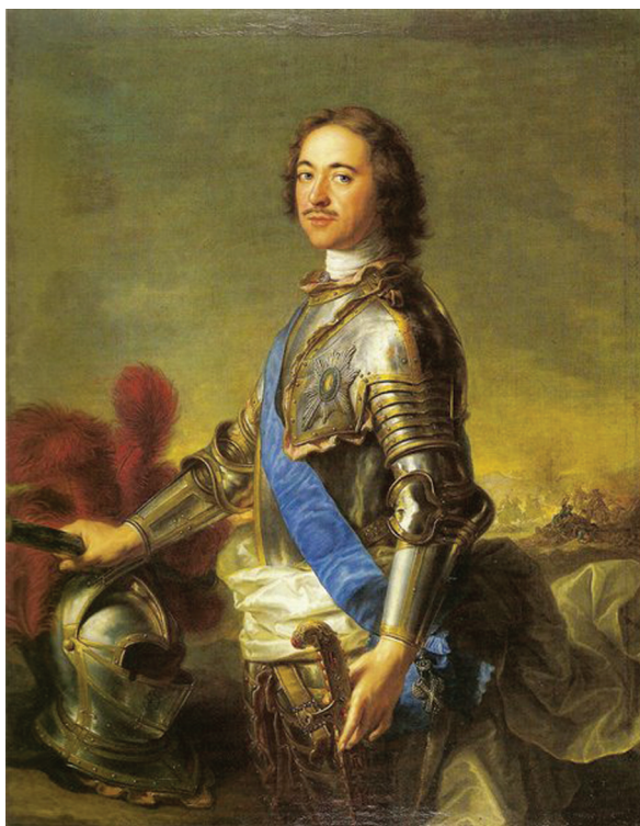
Рис. 2. Жан-Марк Наттье. Портрет Петра I. 1717 г.