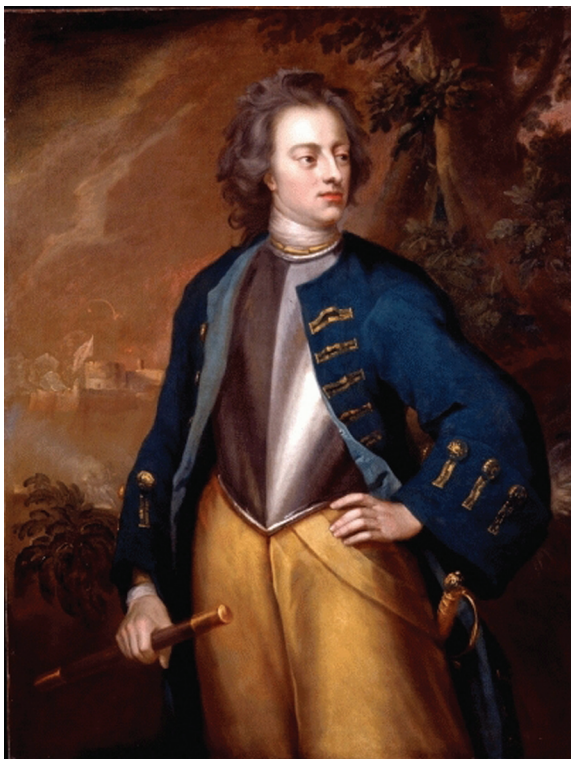
Рис. 3. Михаэль Даль. Портрет Карла XII. 1714 г.