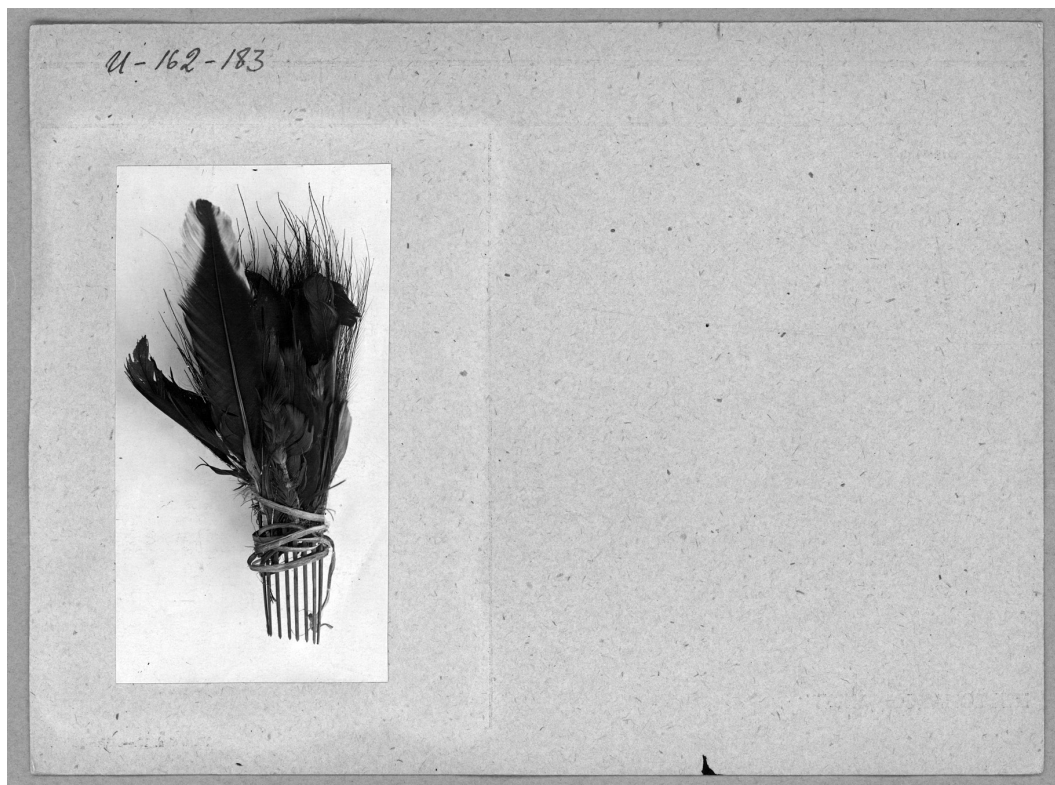
Рис. 1 а, б. Карточный каталог отдела Австралии и Океании. Предмет МАЭ № 168-3/3б. Рисунок Т. Л. Юзепчук Fig. 1 a, b. Card catalog of the Department of Australia and Oceania. Item MAE No. 168-3/3b. Drawing by T. L. Yuzepchuk