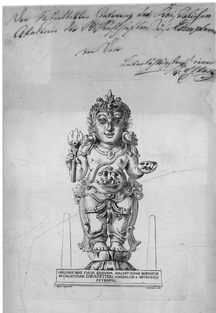
Рис. 2. К. И. Кольман. Гравюра с изображением статуэтки индийского божества из коллекции К. А. Эттера. Санкт-Петербург. 1812 г. МАЭ № 719-108/9-7