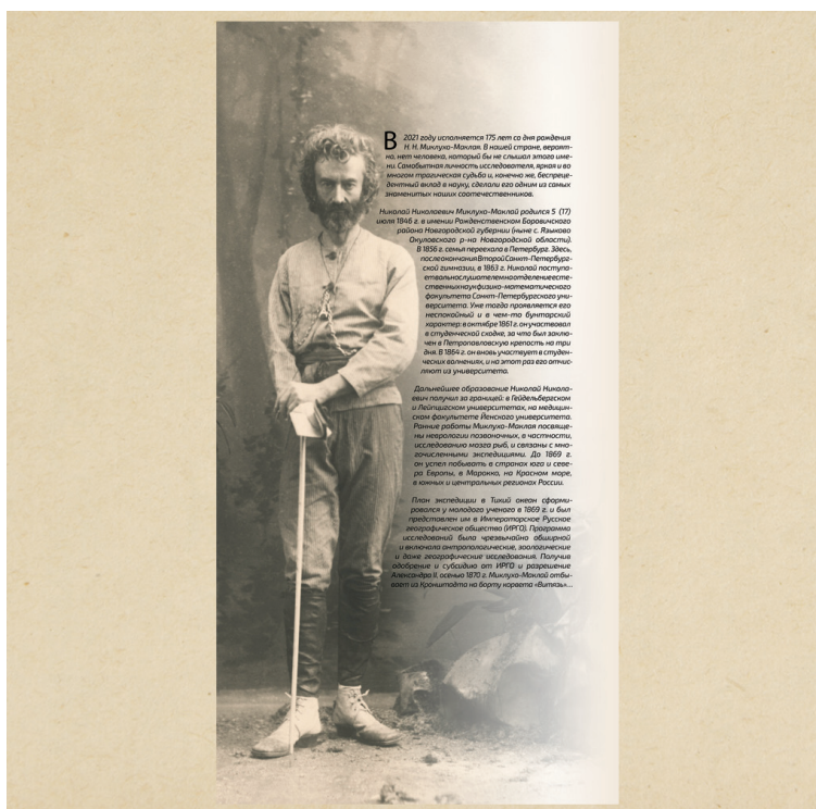
Рис. 4. Изображение Н. Н. Миклухо-Маклая и сопроводительный текст к выставке «Николай Николаевич Миклухо-Маклай: к 175-летию со дня рождения» (баннер), МАЭ РАН, 2021 г. Fig. 4. Image of N. N. Miklukho-Maclay and accompanying text for the exhibition «Nikolai Nikolayevich Miklouho-Maclay: on the occasion of the 175th birthday» (banner), MAE RAS, 2021