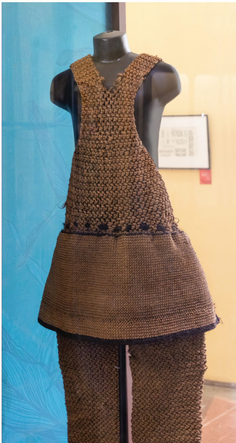
Рис. 2. Комбинезон из кокосового волокна — элемент военного облачения микронезийцев островов Гилберта (Республика Кирибати). Фрагмент выставки «Николай Николаевич Миклухо-Маклай: к 175-летию со дня рождения», МАЭ РАН, 2021 г.