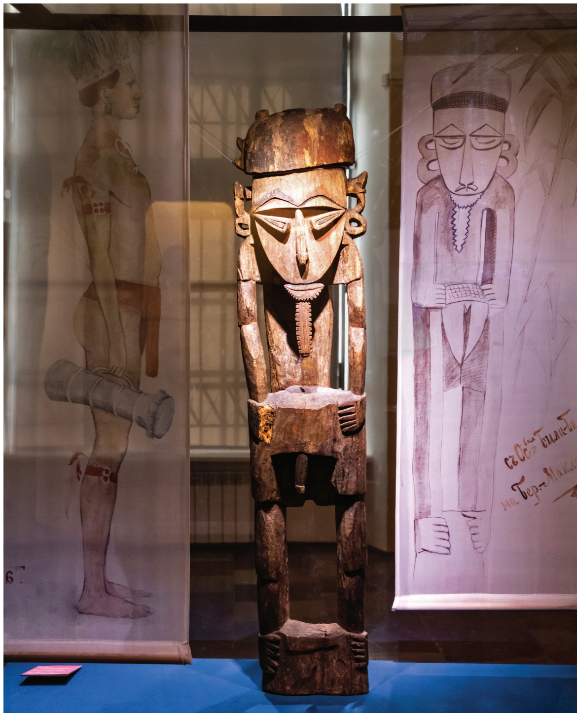
Рис. 1. Телум мужской (в центре); рисунки Н. Н. Миклухо-Маклая с изображением телума женского (справа) и папуаса в праздничном облачении (слева). Фрагмент выставки «Николай Николаевич Миклухо-Маклай: к 175-летию со дня рождения», МАЭ РАН, 2021 г. Fig. 1. Male telum (in the center); drawings by N. N. Miklouho-Maclay depicting a female telum (on the right) and a Papuan in festive attire (on the left). Fragment of the exhibition «Nikolai Nikolayevich Miklouho-Maclay: on the occasion of the 175th birthday», MAE RAS, 2021