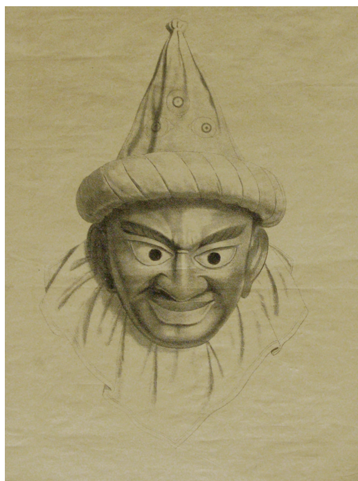
Рис. 4. Монохромное изображение маски божества Lhatung . Германия (?), вторая половина XIX в. МАЭ № 748-8/4-3