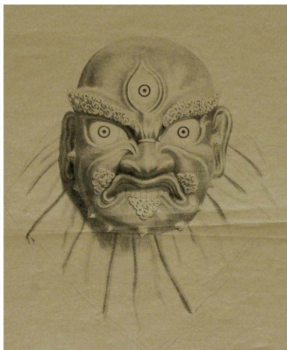
Рис. 3. Монохромное изображение маски божества Lhachen . Германия (?), вторая половина XIX в. МАЭ № 748-8/4-2