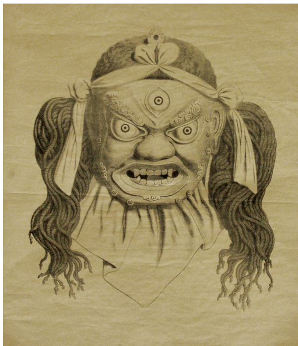
Рис. 1. Монохромное изображение маски Gonyan serpo . Германия (?), вторая половина XIX в. МАЭ № 748-8/4-1