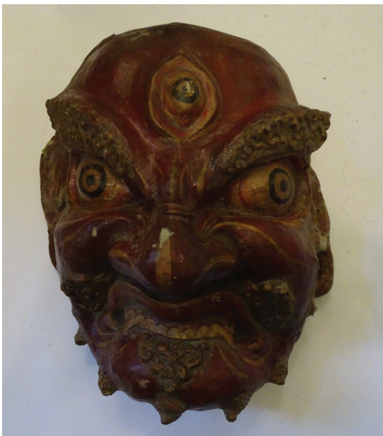
Рис. 7. Маска божества Lhachen . Ладакх, середина XIX в. ГЭ, инв. № ВЭсэ-944

Fig. 6. Gonyan serpo mask. Ladakh, mid-19th century. The State Hermitage Museum. Inv. No. VEse-953