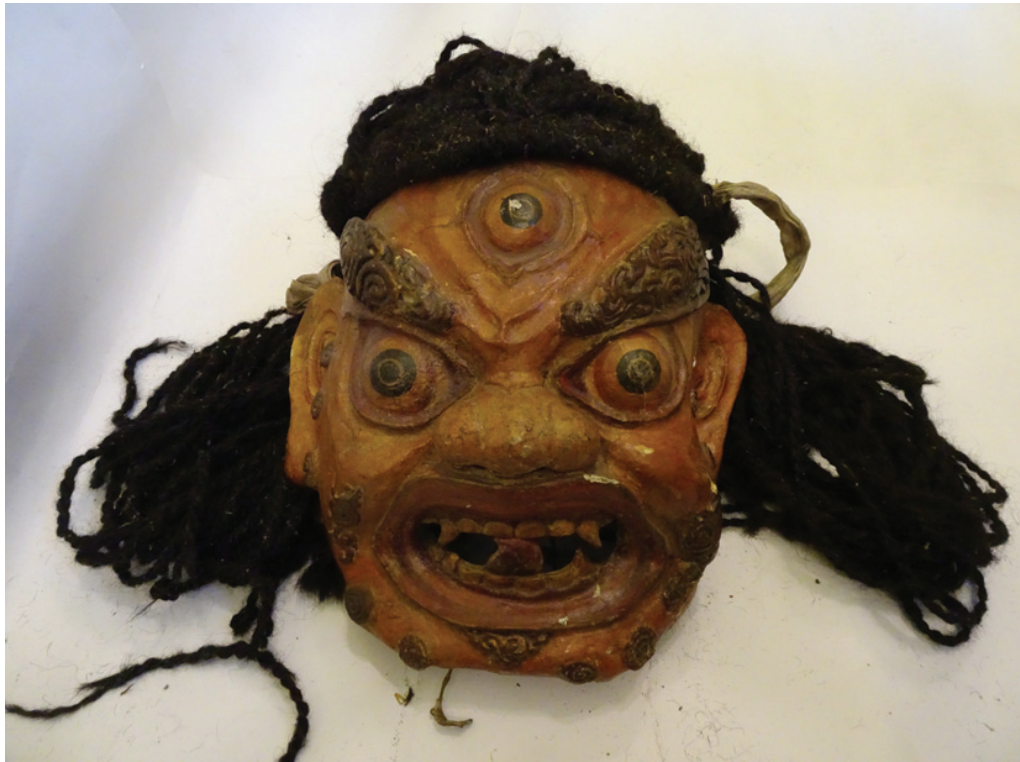
Рис. 6. Маска Gonyan serpo . Ладакх, середина XIX в. ГЭ, инв. № ВЭсэ-953

Fig. 6. Gonyan serpo mask. Ladakh, mid-19th century. The State Hermitage Museum. Inv. No. VEse-953