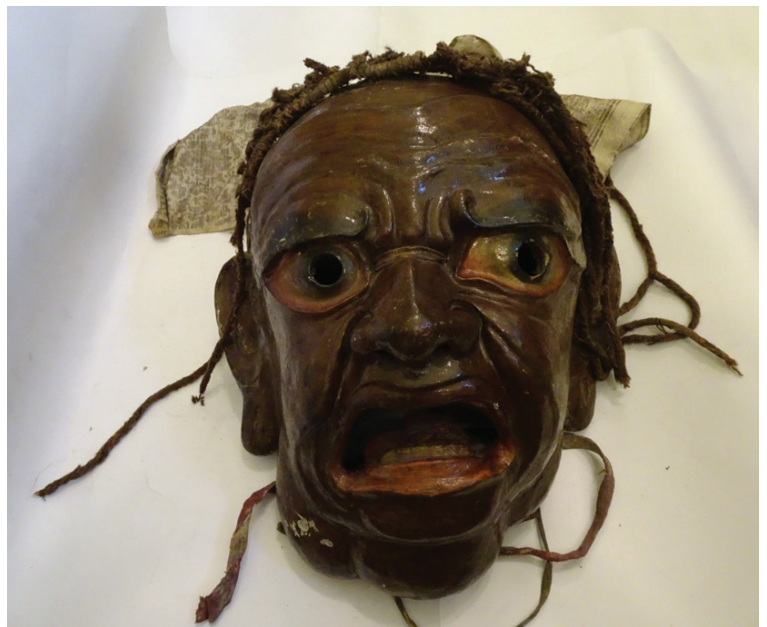
Рис. 8. Маска злого духа. Ладакх, середина XIX в. ГЭ, инв. № ВЭсэ-949

Fig. 7. Mask of the deity Lhachen . Ladakh, mid-19th century. The State Hermitage Museum. Inv. No. VEse-944