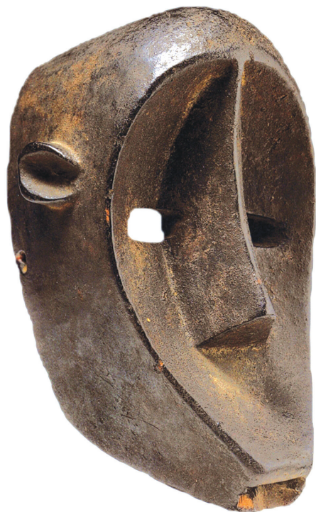
Рис. 2. Маска обезьяны. Бамбара, Мали. Замок Сфорца, Милан.