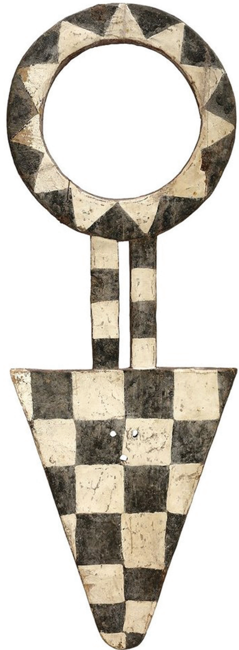
Рис. 7. Маска Беду. Регион Бондукку, Нафана, Кот-д'Ивуар. Дерево, резьба, раскраска. Середина XX в. Морган Оакс Гэллери, Сан Франциско.