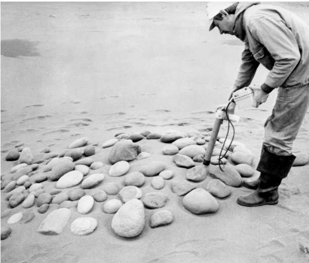
Рис. 3. Я. В. Кузьмин у галечной выкладки на берегу Куйбышевского залива. О. Итуруп, 20 сентября 1990 г.