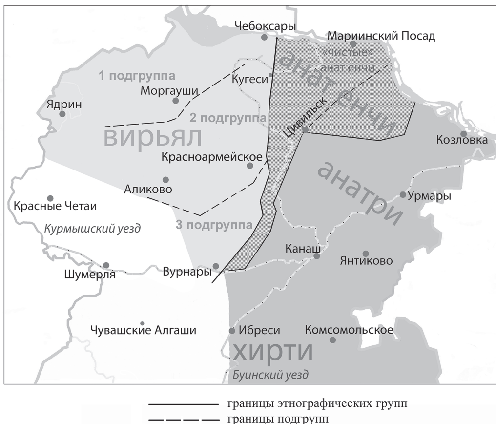
Рис. 1. Карта-схема № 4 «Примерные территории этногрупп и подгрупп чувашей по Г. И. Комиссарову»

Относительно Орбашки необходимо сказать, что такого притока у Вылы нет. Орбашка — приток р. Сорма и протекает южнее рассматриваемой территории. Скорее всего, имелся в виду