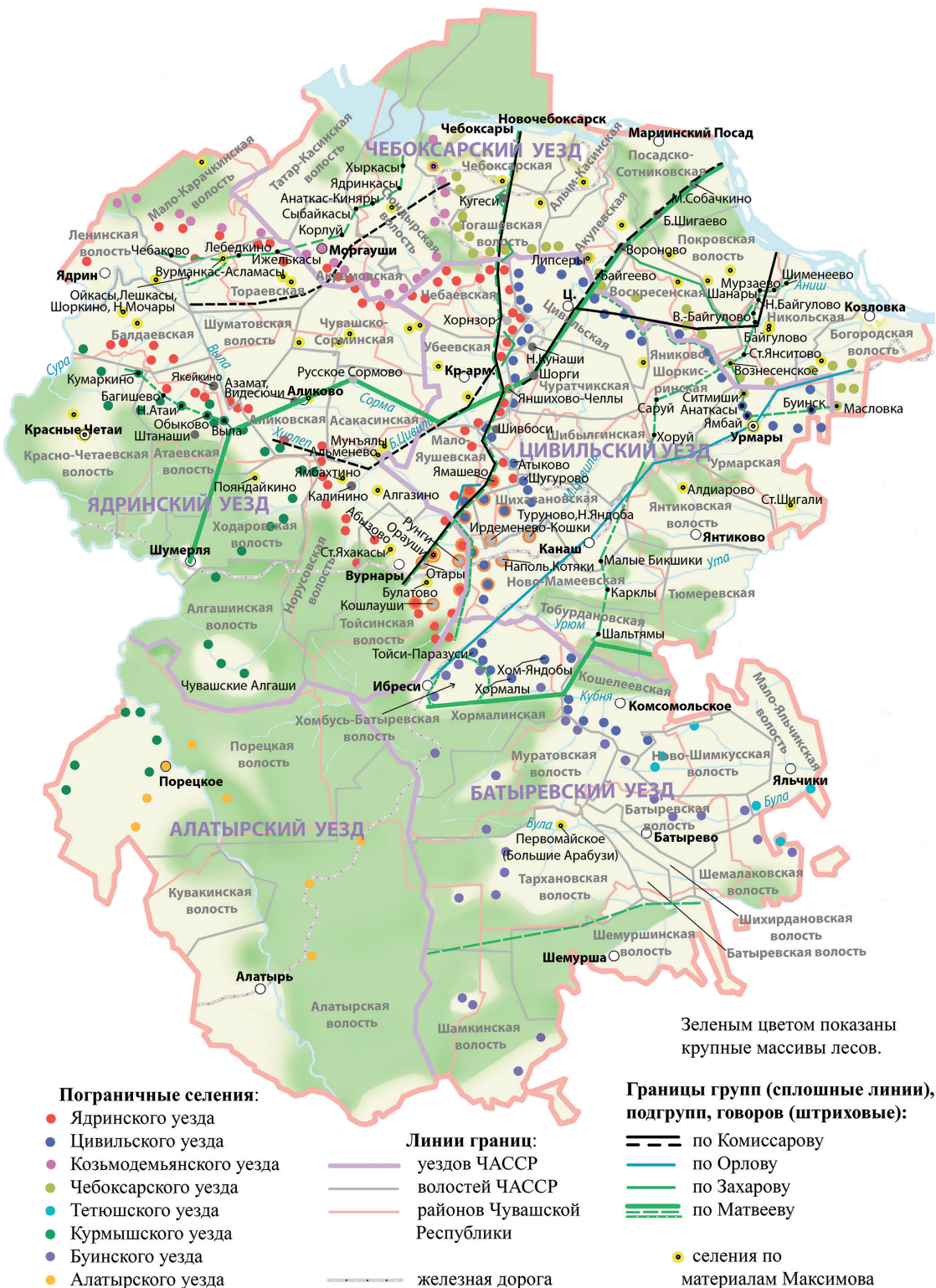
Рис. 3. Карта-схема № 3. Границы говоров, подговоров и зона бытования песен верховой группы чувашей по материалам 1920-х гг. Т. М. Матвеева, С. М. Максимова