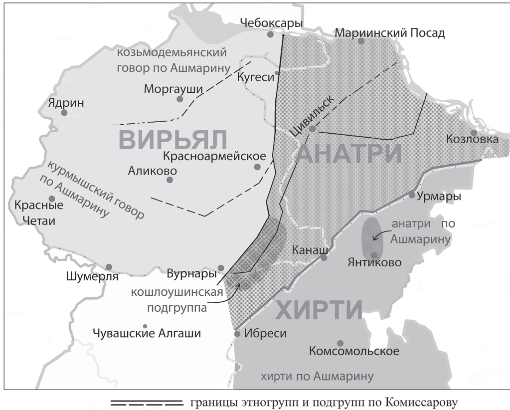
Рис. 2. Карта-схема № 5 «Примерные территории этногрупп, подгрупп, говоров чувашей по П. И. Орлову, Н. И. Ашмарину».