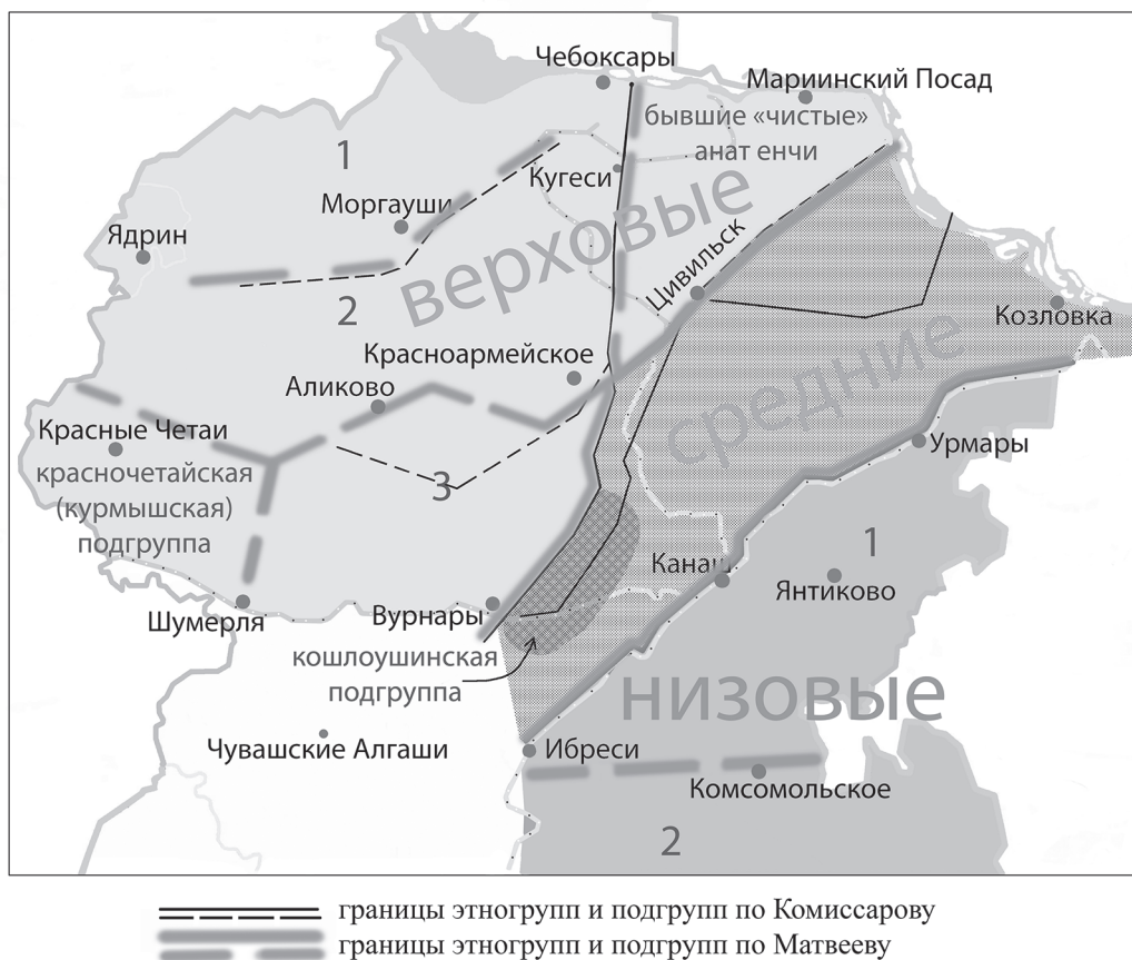
Рис. 3. Карта-схема № 6 «Примерные территории этногрупп, подгрупп чувашей по Т. М. Матвееву»