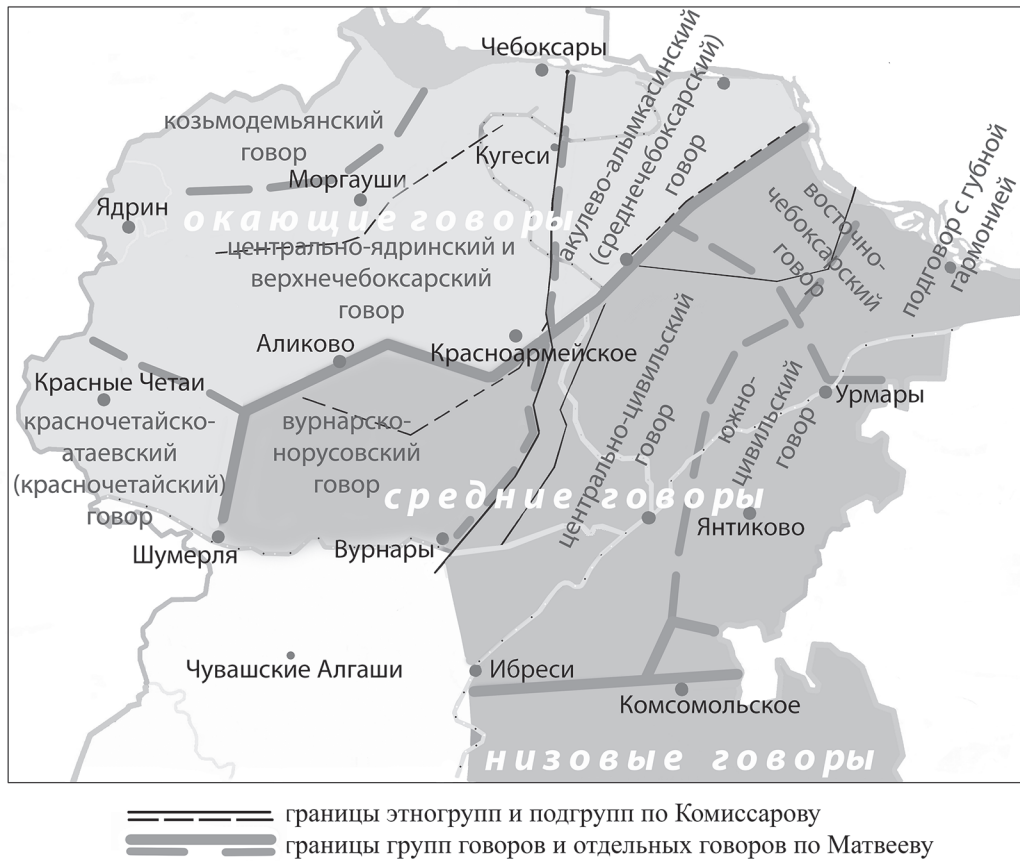
Рис. 4. Карта-схема № 7 «Примерные территории групп говоров и отдельных говоров по Т. М. Матвееву»