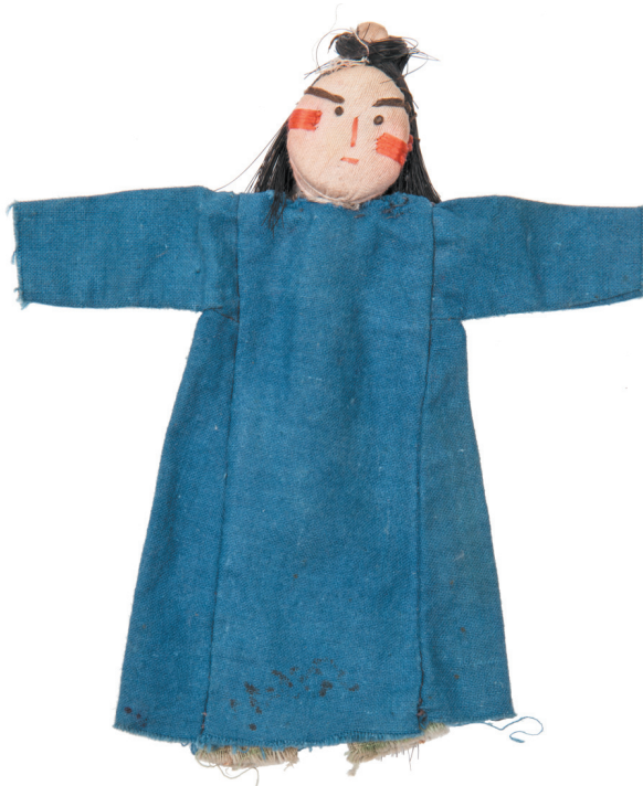
Рис. 6. Кукла. Уйгуры. Восточный Туркестан, Кугарский округ. Начало XX в. РЭМ 5275-53