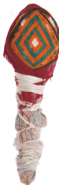
Рис. 4. Кукла-младенец. Припамирские народы: рушанцы. Горно-Бадахшанская автономная область, Рушанский р-н. 1970–1976 гг. РЭМ 8750-358