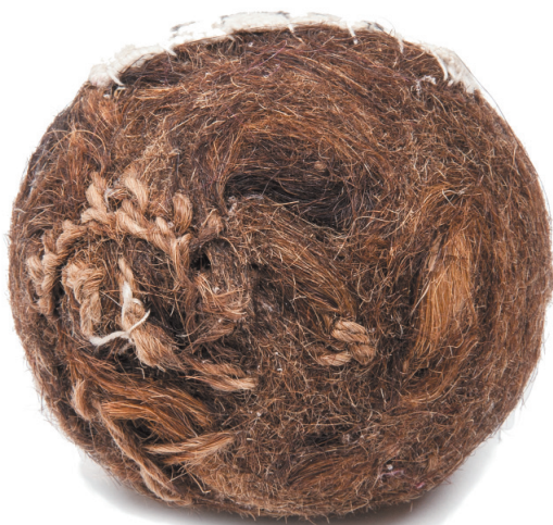
Рис. 3. Мяч. Киргизы. Туркестанская АССР, Семиреченская обл., Нарынский уезд. 1920-е гг. РЭМ 8762-23194