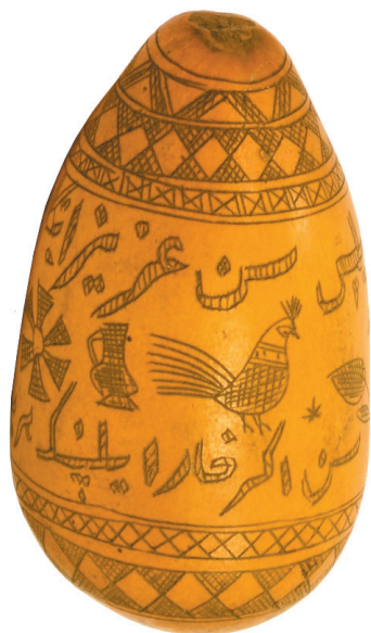
Рис. 1. Погремушка. Таджики, узбеки. Самаркандская обл. Конец XIX в. РЭМ 8761-12721