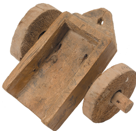
Рис. 2. Игрушка-арба. Узбеки. Узбекская ССР, г. Бухара. 1930-е гг. РЭМ 6772-126