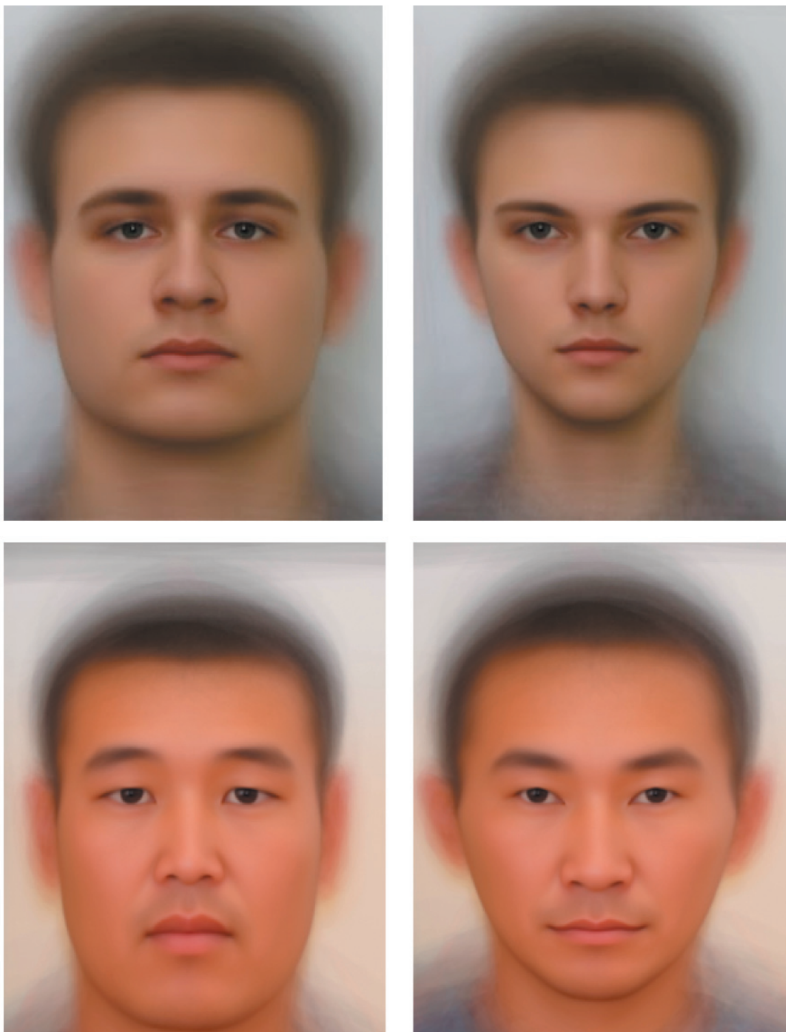
Рис. 1. Стимульный материал исследования. Представлены морфы русских и тувинских мужчин, отражающие высокий (слева) и низкий (справа) уровень физической силы (подробнее см.: Mezentseva et al. 2024)